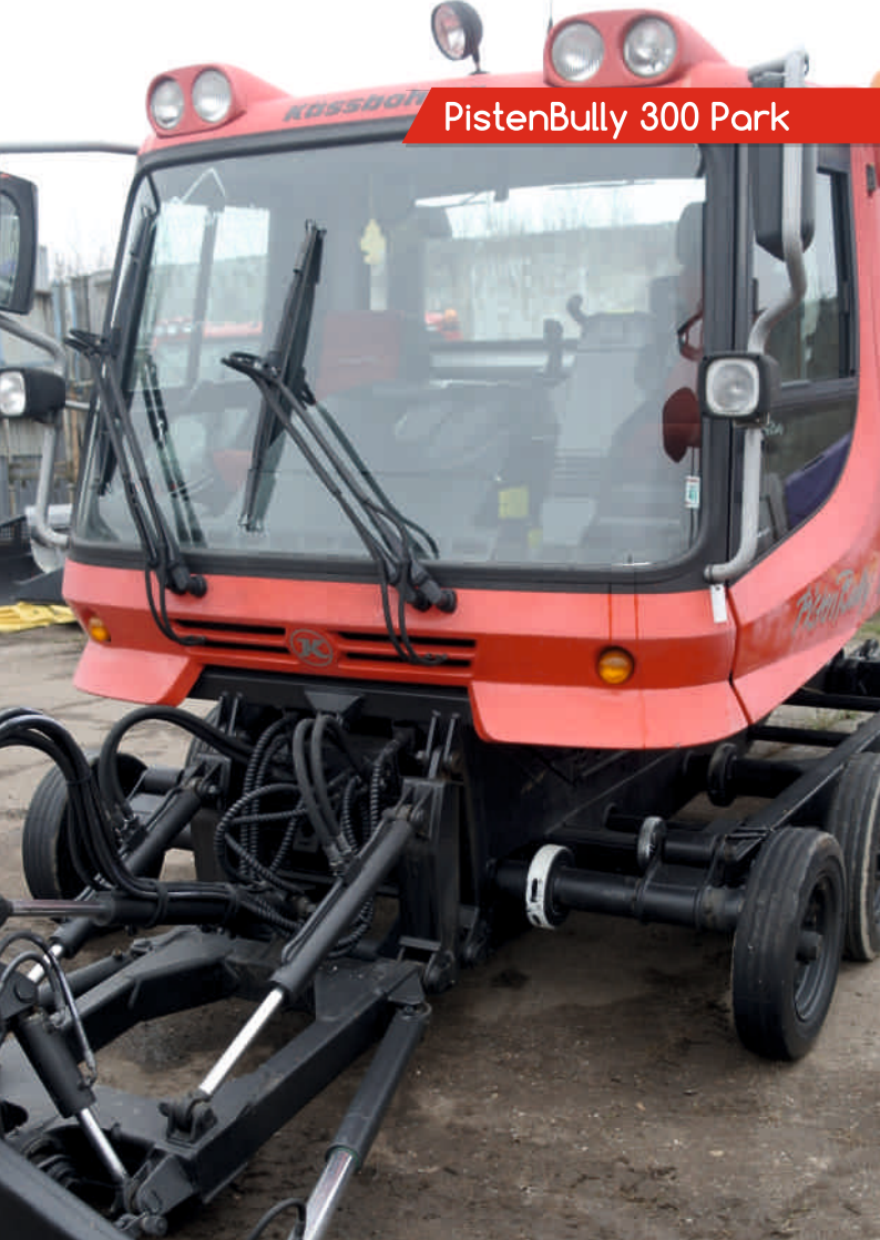
PistenBully 300 Park